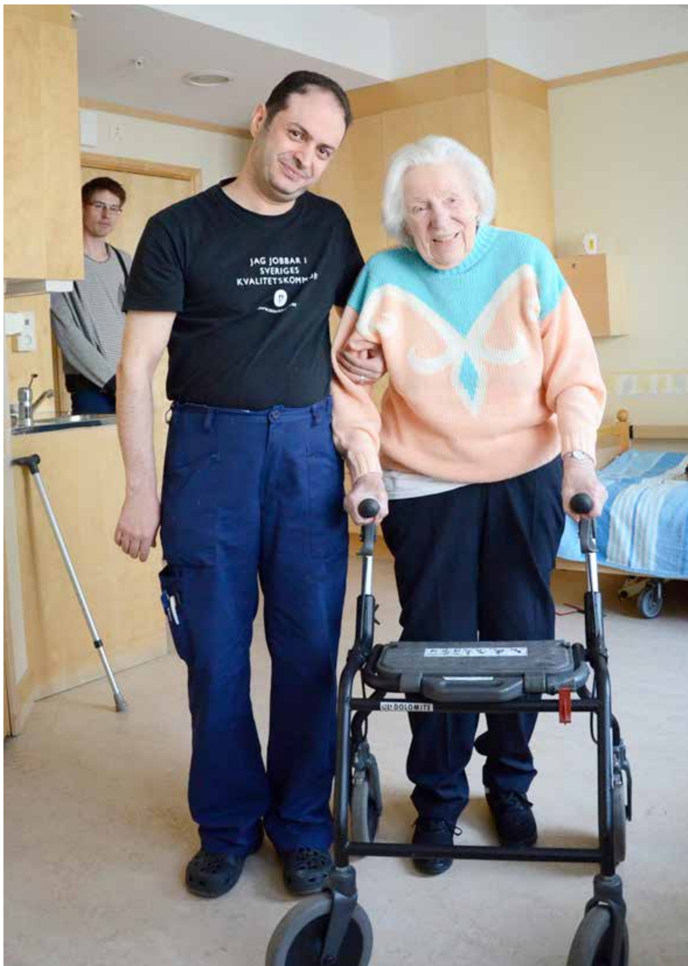
Valideringen av de praktiska momenten i omsorgsarbetet sker på arbetsplatsen eller i ett metodrum.