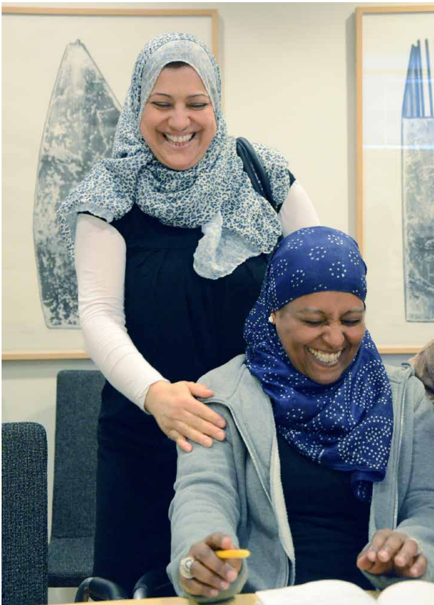
När läraren använder deltagarnas erfarenheter från olika omvårdnadssituationer i undervisningen ökar motivationen och engagemanget.