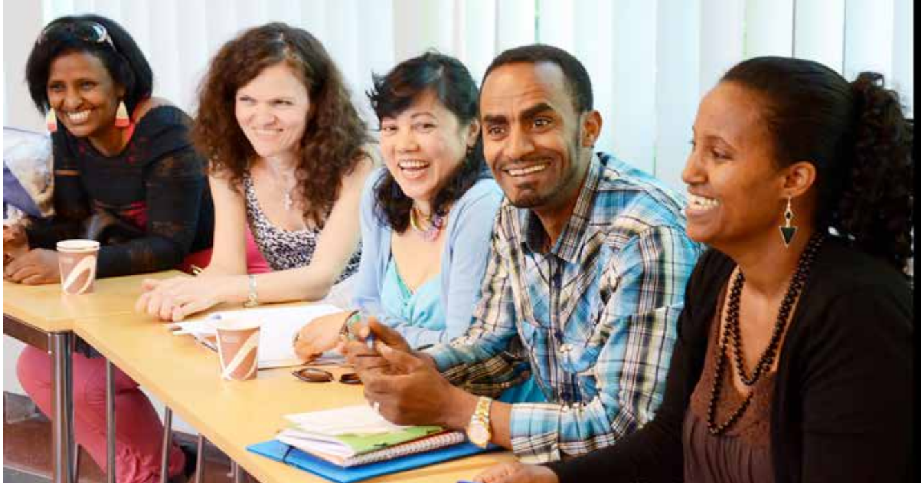
Deltagaren måste själv vara motiverad av att delta i integrerad undervisning med validering samt ha tillräckliga språkkunskaper.

arbeta kring planeringen av utbildningen och valideringen. De behöver besluta om hur urval av deltagare ska göras och hur information ska ges till deltagare och övrig personal.