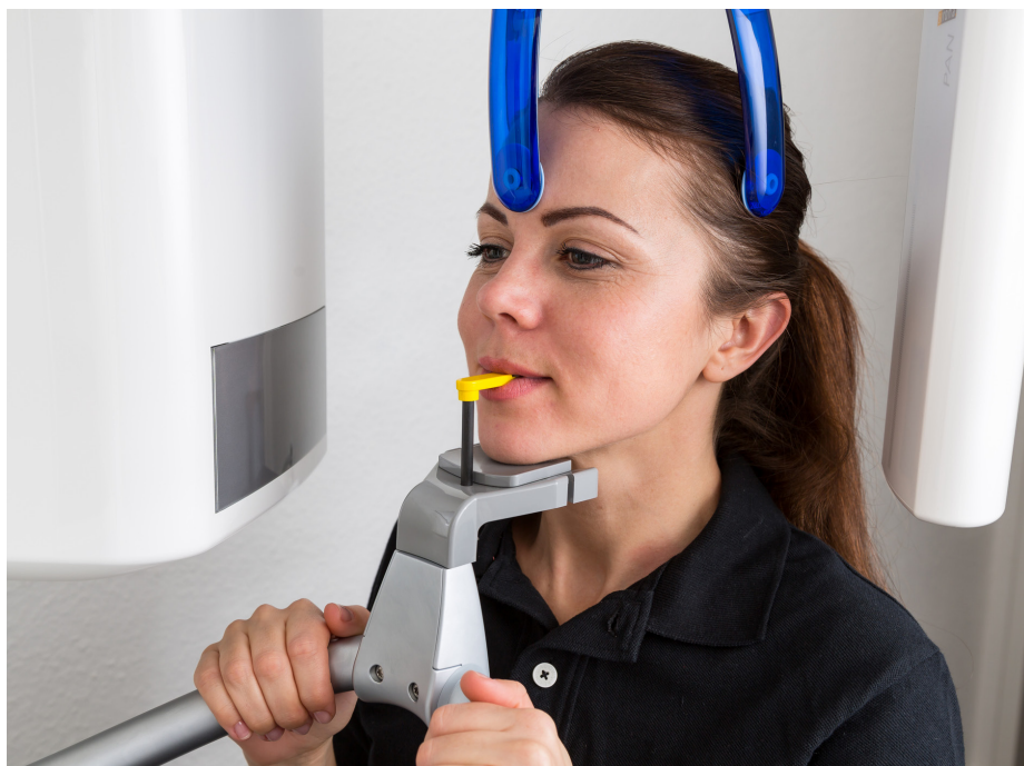
Panoramaröntgen används inom tandvården, men kan nu få utökad betydelse.

Insjuknande i stroke och hjärtinfarkt registrerades under de följande tio åren, eller tills att