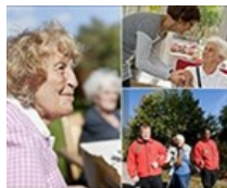
Seminarier och utbildningar hösten 2017

Den 26 januari 2018 planerar Stiftelsen Äldrecentrum en heldagskonferens med tema våld mot äldre i nära relation. Boka in datumet redan nu! Mer information publiceras inom kort på www.aldrecentrum.se .